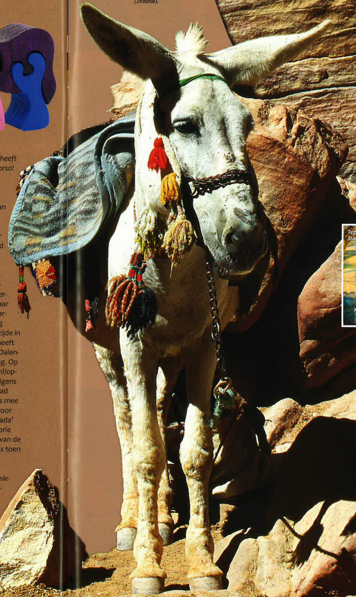
Toeristenezel in Petra (Jordanië).

De uitgave de EZEL : archeologie - geschiedenis - cultuur - kunst - literatuur (ISBN 978-90-9028314-2) is in eigen beheer uitgegeven. Het boek is te koop bij boekhandel Lovink in Lochem en de museumwinkel van het Rijksmuseum van Oudheden te Leiden. Daarnaast kan het worden besteld via www.deEZEL.nl . Het boek kost € 29,90, exclusief verzendkosten.